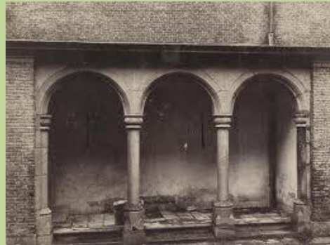
De vierschaar op de binnenplaats

Het beheer over het gebouw wordt door de Rijksgebouwendienst gevoerd. Vooral sinds 1950 werd het kasteel met stukjes en beetjes gerestaureerd. De voltooiing van deze restauratie vond plaats in 1980 en in oktober 1980 werd het hostel feestelijk heropend. Momenteel worden er per jaar 30.000 overnachtingen geboekt door scholen, groepen en individuen uit 45 verschillende landen. Het slot heeft dan ook 40 kamers en andere ruimten.