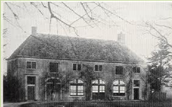
De oranjerie, links voor het kasteel

grote zaal naar kasteel Marquette overbrengen. Ook de marmeren schoorstenen en vier deuren met hun omlijsting werden daarheen gebracht. Tenslotte werd het tot bijna ruïne vervallen kasteel op 18 september 1911 aan het rijk verkocht. De grote vijver werd in 1933 gedempt met onverkoopbare bloembollen. Omdat de provincie Noord-Holland zo weinig kastelen telde werd besloten het gebouw te restaureren. Een bestemming als jeugdherberg waarborgde het sociale nut van het oude slot. Op 15 juli 1933 vonden de eerste trekkers er onderdak. Tijdens de oorlog van 1940/45 legerden de Duitsers zich in het kasteel. Na de bevrijding diende het als huis van bewaring voor een dertigtal politieke gevangenen.