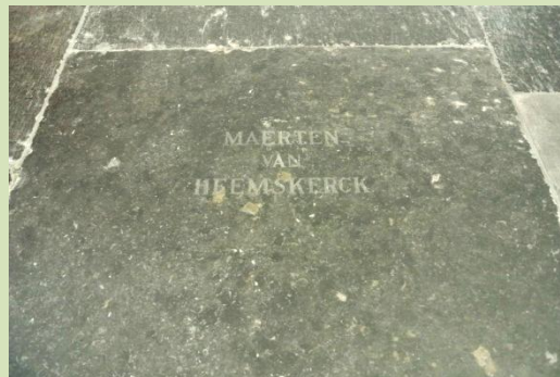
Gedenkplaque en grafsteen in de Grote of Oude Sint Bavokerk in Haarlem