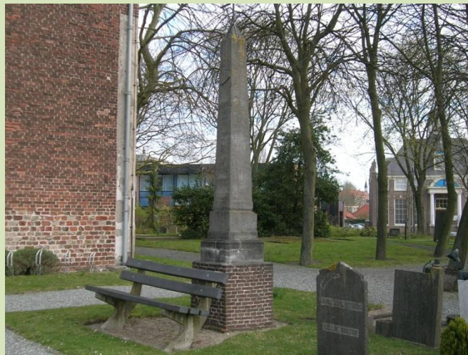
De replica van het gedenkteken voor de vader van Maerten van Heemskerck op het kerkhof van de dorpskerk te Heemskerk.

Het originele gedenkteken staat tegenwoordig ter bescherming tegen weersinvloeden in de toren van de dorpskerk. Op het kerkhof staat een replica.