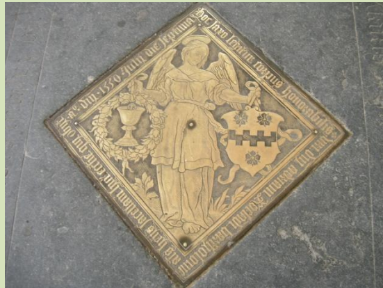
Bronzen plaquette op een grafsteen in de grote kerk van Breda door Maerten van Heemskerck