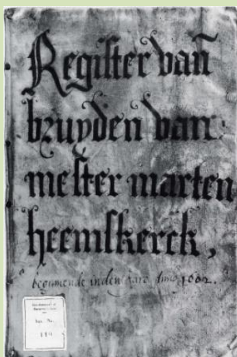
Het register van bruiden