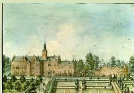
De tuin en parkaanleg rond 1720

Het landgoed zelf is vrij toegankelijk en wordt gezien als een oase van rust in het moderne drukke Heemskerk.