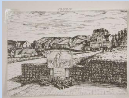
Oorlogsmonument Wijk aan Zee

Nieuwe groepen in de stad kwamen tot welvaart en ook zij wisten de weg te vinden naar de kust bij Wijk aan Zee. Winkeliers en arbeiders stapten op hun vrije zondag op de pakketboot in Amsterdam en voeren naar de steiger bij Velsen-Noord, toen nog Wijkeroog geheten. Vandaar wandelden zij door de Breesaap en het landgoed Rooswijk over de Bosweg naar de zuidvoet van het Paasduin en zo kwamen zij in Wijk aan Zee. Tegen de avond legden zij dezelfde weg af en voeren terug naar de kade achter het Centraal Station van Amsterdam.