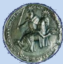
Wolfert van Borsselen