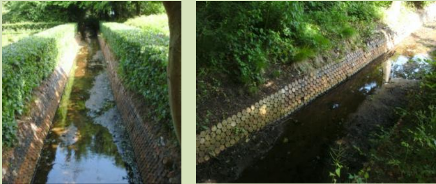
De Scheybeek of Kruikenbeek

tussen Velsen en Beverwijk in 1818 kwam het voordien bij Velsen behorende gedeelte van de buitenplaats bij Beverwijk.