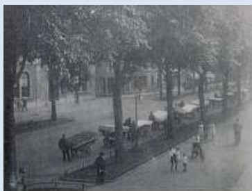
In de rij op de Breestraat