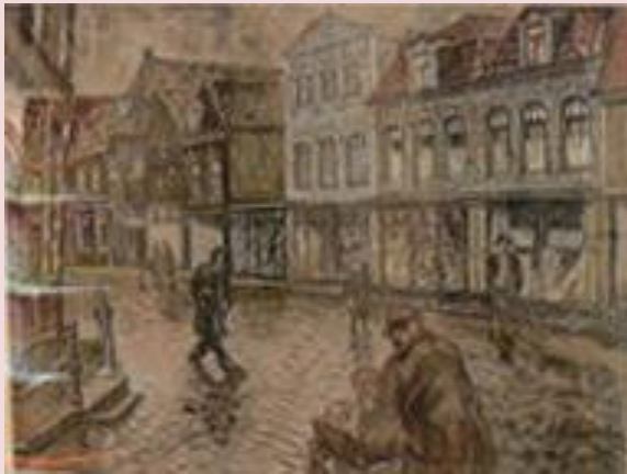
Schilderij door Natasja Kamstra-Rassamachina, De oude winkelstraat in Hoorn met de winkel van de fam. Botman, de voorloper van de HEMA

De Vereniging tot Bevordering van Katholiek Bijzonder Onderwijs in het Bisdom Haarlem werd in 1869 opgericht. Pas in 1897 werd er door de vereniging een eigen school gesticht, een kweekschool en wel in Hoorn. De redenen om de school in Hoorn te situeren werd als volgt geformuleerd: 'Omdat die stad door hare ligging en door de afwezigheid van overdreven uitspanningsmiddelen minder afleiding biedt voor de studie en minder gevaar voor de zeden.' De school stond aan de Gouw op nr 14. Het was een groot herenhuis dat werd afgebroken om plaats te maken voor de uitbreiding van de HEMA. Het bestaat dus niet meer.