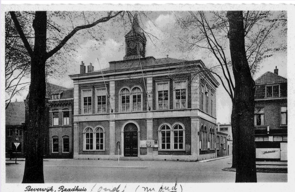
Beverwijk, Raadhuis (oud) (nu oud)