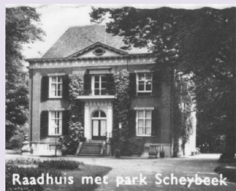
Raadhuis met park Scheybeek

In 1946 werd huize Scheybeek het zevende raadhuis (als we die van Wijk aan Zee en Duin meetellen). In 1924 werd het pand voor de sloop behoeft, als de gemeente door Monumentenzorg gedwongen wordt de buitenplaats te kopen. De gemeente verkoopt de buitenplaats echter weer snel aan de familie van Hattum, die er nog een aantal jaren woont. Tussen 1946 en 1965 is het huis in gebruik als gemeentehuis van Beverwijk. Het werd in de eerste instantie gehuurd van de erven van Hattum. In 1950 kocht de gemeente het huis en het bleef tot begin 1965 raadhuis. Sinds 1989 is de buitenplaats in beheer van de Stichting Scheybeek. In 2000 is het in eigendom overgegaan aan Buko Beheer. Het gebouw wordt nu gebruikt voor evenementen en als trouwzaal.