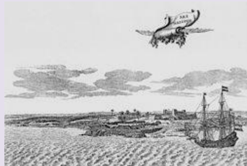
Gezicht op Fort Oranje

Op de westelijke oever van de Hudson werd in 1624 Fort Oranje (Fort Oranije) (in het Engels Fort Orange) in gebruik genomen. Het was het eerste Nederlandse permanente fort in het gebied waar vandaag de dag de staat New York ligt. Fort Oranje verving het in 1615 gebouwde Fort Nassau dat regelmatig te kampen had met hevige overstromingen. Fort Oranje was toen niet meer dan een van hout gemaakte vesting en eigendom van de West-Indische Compagnie (WIC). Het diende als handelspost voor de bonthandel die in die tijd een grote inkomstenbron was voor de WIC.