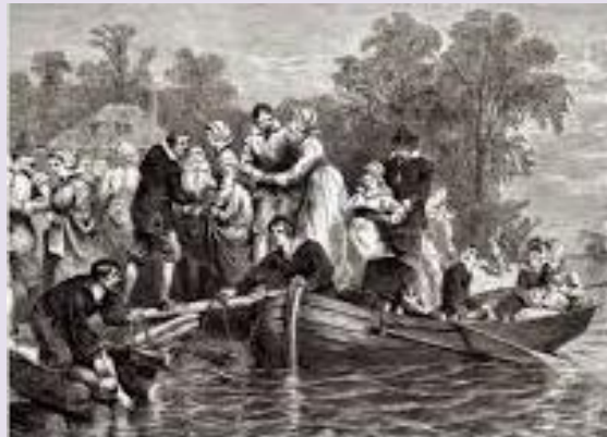
Aankomst van vrouwelijke kolonisten in de Nieuwe wereld

Mannen op zoek naar een huwelijkspartner maakten de meeste kans in het nabijgelegen Nieuw-Amsterdam en weduwen hadden in de kolonie geen enkele moeite om een tweede man te vinden. Andere jongemannen vergrepen zich, tot onvrede van de predikant en de patroon, aan de Indiaanse vrouwen. De oplossing hiervan zag men in het stimuleren van vrouwen om als kolonisten naar Rensselaerswijck te komen. Hier lag een taak voor de patroon in Holland die zich dan ook vlijtig van die taak kweet. Ook gezinnen met veel dochters waren extra welkom. Vanaf 1644 was er dan ook een toename in het aantal familie-immigraties naar de kolonie. Toch is het tekort aan vrouwen is in de periode tot 1664 nooit helemaal opgelost.