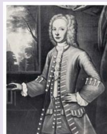
Kiliaen Van Rensselaer

De WIC stelde de "Vrijheden en Exemptiën" vast die voor de patroonschappen zouden gelden. Deze "Vrijheden en Exemptiën" bevatten de basisregels voor het stichten van een patroonschap in Nieuw-Nederland. Ieder die binnen vier jaar vijftig personen naar een vooraf bepaald territorium kon verschepen kon recht doen op de titel patroon. Albert Burgh, Samuel Blommaert, Samuel Godijn, Johannes de Laet hadden weinig succes met het bevolken van de kolonie en het zich verdedigen tegen de plaatselijke indianen. Alleen Kiliaen van Rensselaer wist zich in het noorden te handhaven langs de Hudson. Deze Kiliaen had zich direct aangemeld als patroon voor een kolonie rond Fort Oranje aan de Noordrivier (tegenwoordig de Hudson). Hij kocht via Bastiaen Jansz. Krol land van de indianen en ging een samenwerkingsverband aan met zijn medebewindhebbers Albert C. Burgh, Samuel Blommaert en Samuel Godijn. In 1631 trad hij af als bewindhebber van de Amsterdamse Kamer van de WIC en wijdde zich vanuit Amsterdam aan de verdere ontwikkeling van de landbouw en veeteelt in zijn nieuwe kolonie, die hij Rensselaerswijck noemde.