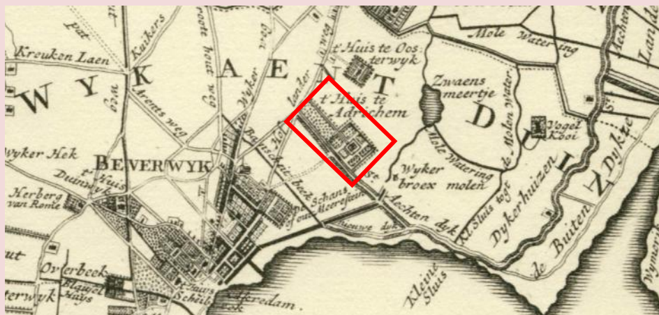
Kaart van Brouwerius van Nidek uit 1728

't Huis te Adrichem zoals het op de kaart van Brouwerius van Nidek uit 1728 te zien is, is gelegen in Wijk aan Duin aan de St. Aechtendyk enerzijds en de Hof Landerweg anderzijds. Het is een omvangrijk goed. De ingang van het geheel ligt via een lange oprijlaan aan de Hof Landerweg. Het huis is omgeven door een gracht en verschillende tuinen en boomgaarden. Uit een beschrijving van bezittingen uit 1808 weten we dat rondom het kasteel 'Capitaale Appelen, Peeren- en Karssen boomgaarden en een extra groote moes- en broeituin met een annanasse-bak, diverse persike, abricosen en druivenkassen, een menagerie, goudviskom en vijvers, Engelse plantsoenen met inlandsche en vreemde gewassen, graspartes en slingerlanen' gelegen waren. Tegenwoordig is van de tuinen niets meer van terug te vinden.