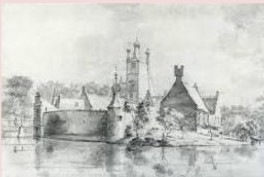
Roelant Roghman 1646-1647

We weten nu de locatie van het kasteel maar we weten ook hoe het er in vroeger tijden heeft uitgezien. Er zijn verschillende afbeeldingen van gemaakt en bewaard gebleven.