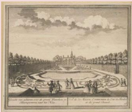
Hendrik de Leth 1728 achterzijde