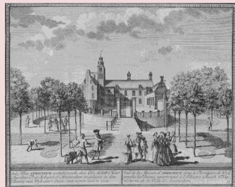
Hendrik de Leth 1728