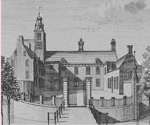
Adrichem rond 1730 door Cornelis Pronk