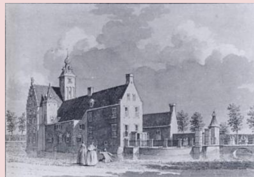
Cornelis Pronk 1753