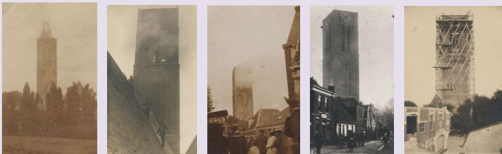
De toren in brand, met spits, zonder spits, na de brand en de herbouw

Op woensdag 21 augustus 1912 werd de wijkertoren gedeeltelijk verwoest door een fel uitslaande brand, hierbij werd het bovenste deel van de toren verwoest, de toren werd herbouwd, maar de tekst Fugit Hora (de tijd vliegt) die voorheen op de wijzerplaten van de klokken stond werd naar binnen verplaatst.