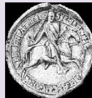
Zegel van graaf Thibaud IV

De bezoekende kooplieden genoten de bescherming van de graven van de Champagne, toen was dat graaf Thibaud IV die ook de markt-rechten garandeerde. Niet zonder eigenbelang want de verschillende tollens en belastingen waren een belangrijke bron van inkomsten. Door middel van snelrecht werden ontstane ruzies en meningsverschillen snel opgelost. De eventuele boetes moesten ook worden betaald aan de graaf.