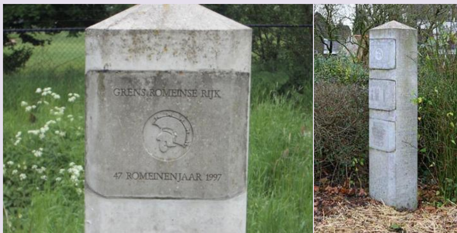
Met deze grenspalen wordt de limes in Nederland aangegeven.

De Limesweg was de belangrijkste heerweg die door de Romeinen werd gebruikt om de vele castella langs de Limes met elkaar te verbinden. De weg liep vanuit het huidige Duitsland door tot aan Katwijk langs de linkeroever van de Rijn. Generaal Agrippa verklaarde in 19 VJ de weg een via militaris, maar behalve een militaire functie had de weg ook een belangrijke rol in de handel en de gezwinde verspreiding van nieuws. Archeologen hebben de Limesweg in Nederland tot 2009 maar liefst 71 keer aangetoond. Vooral ten westen van Utrecht. Sporen van reparaties zijn ontdekt en de reparatiejaren zijn vastgesteld op de jaren 100, 125, 168 en 225. Na het jaar 225 zijn er geen archeologische aanwijzingen meer van het gebruik van deze weg.