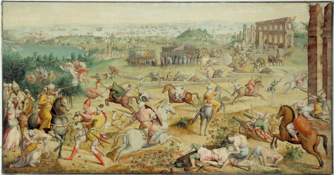
De reis van keizer Karel V naar Tunis. Het schilderij meet 120,8 x 245,8 cm en hangt in het museum van Coburg.