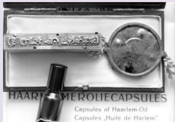
Het originele stempel met geheimschrift dat werd gebruikt op de bijsluiters van echte Haarlemmerolie.